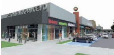
Retail Park - Aviv Arlon