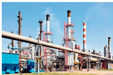
Rafinerija nafte Pančevo