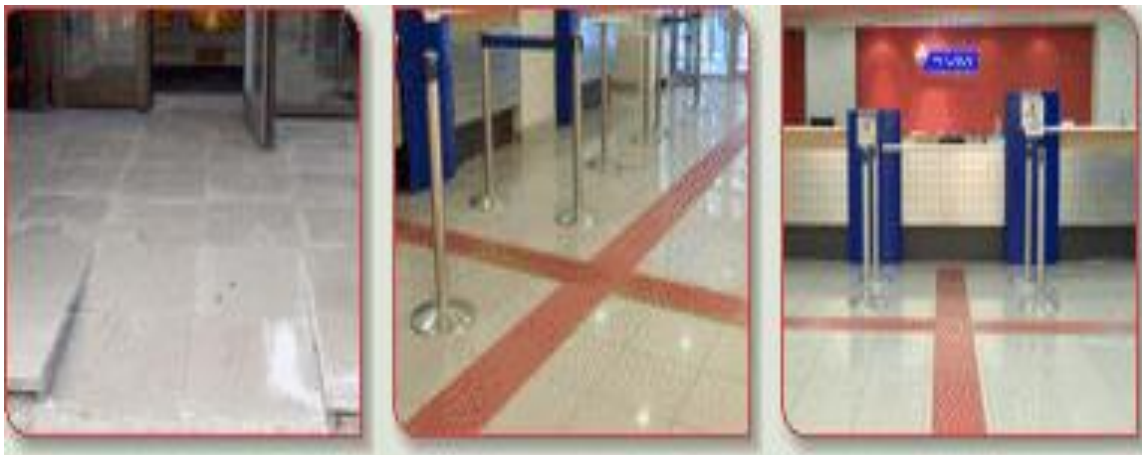
Приступна рампа, ентеријер - различита обрада подне површине, денивелисан шалтер