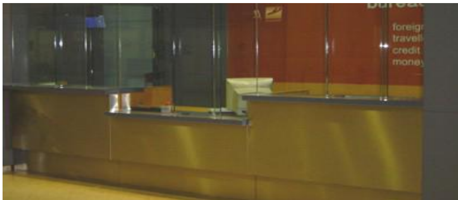
Денивелисан шалтер са подигнутим и спуштеним плочама