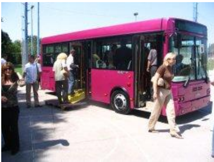
Превозна средства са покретним рампама