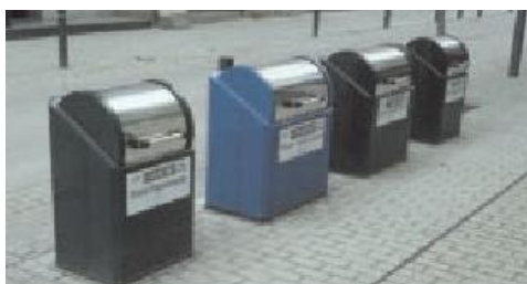
урбани мобилијар корпе за смеће