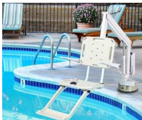
Лифт за базен

* Табелом нису обухваћени школски спортски објекти и терени, терени који су намењени за спортске активности и рекреацију на јавним површинама и објекти фитнес клубова у приватном власништву који нису финансирани из градског буџета.