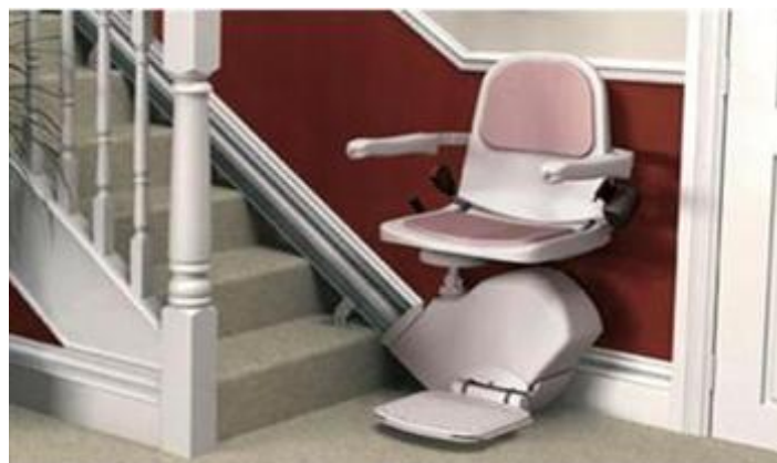
унутрашњи лифт- седиште